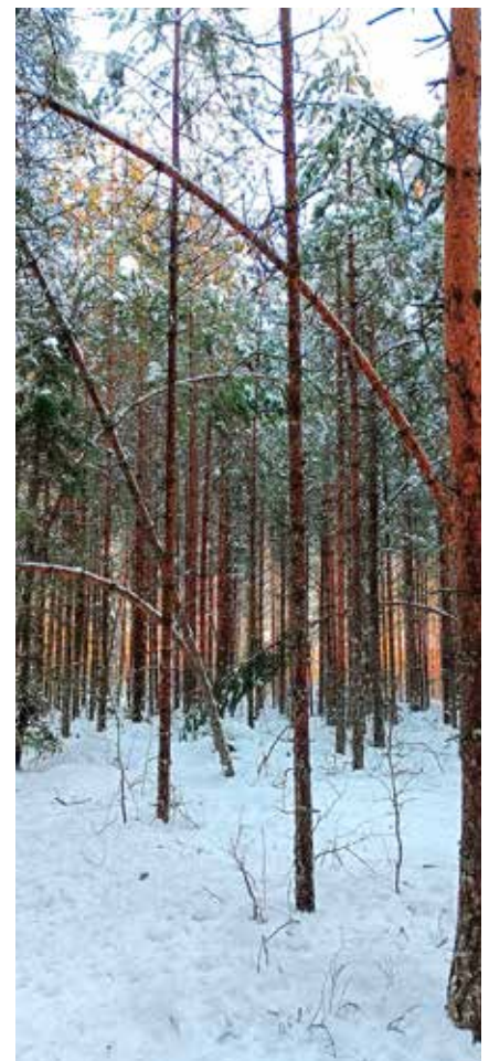
Ei ainakaan vielä katki.

Jos tuho on laaja, kannattaa korjuu tehdä nopeasti. Näin vältetään puiden kuivuminen ja siten jalostusarvon heikkeneminen, sekä pienennetään riskiä jo aiemmin mainittuihin lisätuhoihin. Metsätuholaki velvoittaa korjaamaan tuhopuut talousmetsästä, jos kuusivaltaisella alalla niiden määrä on yli 10 m 3 hehtaarilla. Mäntyvaltaisella alueella raja on 20 m 3 hehtaarilla. Tuhojen laajuuden arviointiin saa apua omalta metsäasiantuntijalta. Lisäksi metsäasiantuntija auttaa arvioimaan, millainen hakkuu tuhoalueella kannattaa tehdä.