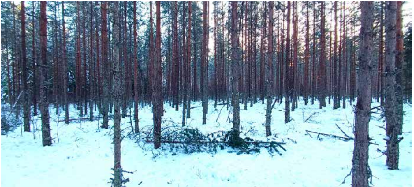
Katkenneita latvoja nuoressa männikössä.